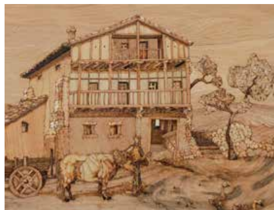
「バスク地方の農家」2023年