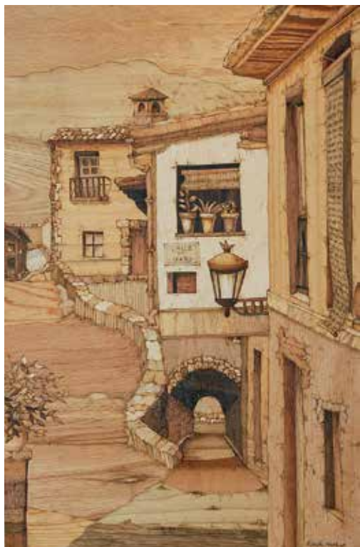
「通り(バスク地方)」2023年